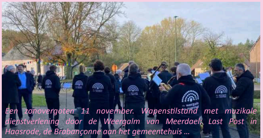
Een zonovergoten 11 november. Wapenstilstand met muzikale dienstverlening door de Weergalm van Meerdael. Last Post in Haasrode, de Brabançonne aan het gemeentehuis ...

Wij zien er hier misschien wat zottekes uit maar vergis je niet! ... Zelfs met carnaval — verkleed als Roodkapje, clowns, hippies — of na het fanatiek paaseitjes zoeken, ... repeteren wij Weergalmers keihard. Hoeveel eitjes we ook vinden, toeternitoe: we oefenen geconcentreerd, intensief...in absolute verbinding met elkaar —samen moe 😊— zodat we ons publiek de mooiste melodieën kunnen aanbieden. Kan het nog leuker worden: prachtige muziek met gezelligheid als hoogste noot? Dachtetniet 😊.