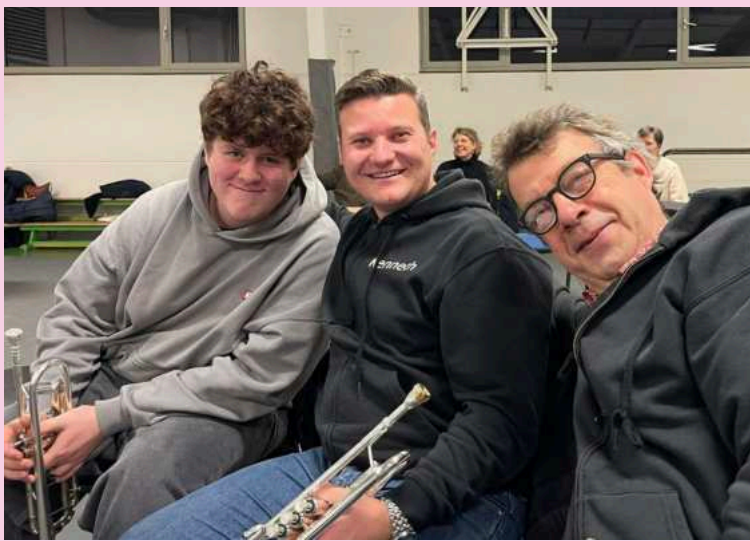
Fotomoment tijdens onze OpenDeurRepetitie, met op de achtergrond een aandachtige Tine Eerlingen, de (toen) kersverse schepen van Cultuur van Oud-Heverlee