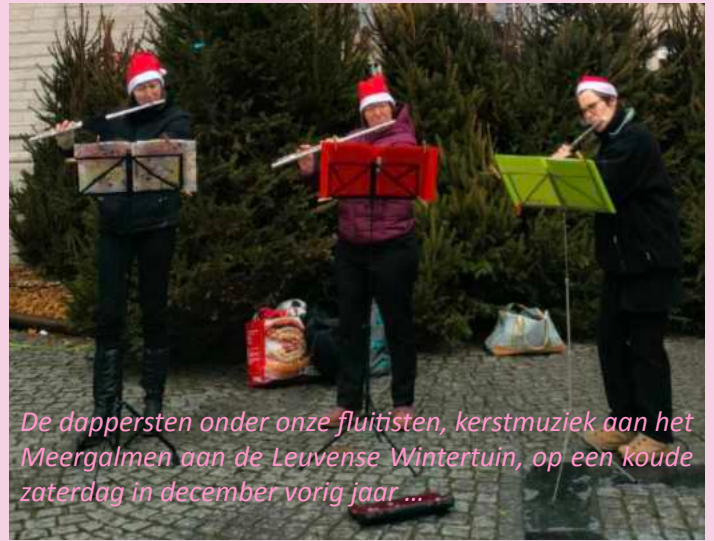
De dappersten onder onze fluitisten, kerstmuziek aan het Meergalmen aan de Leuvense Wintertuin, op een koude zaterdag in december vorig jaar ...