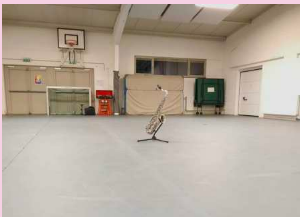
De eenzaamste sax van het land ... Haar baasje? Onze voorzitter, die het na elke repetitie nog zo druk heeft ...