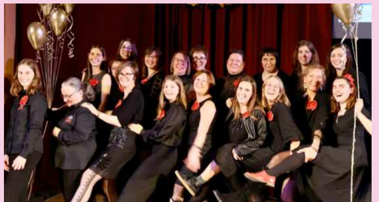
Noteer alvast 15 november voor een nieuwe editie van ons ZoetWaterFestival. Altijd een waar (muziek)feest, zoals duidelijk blijkt uit de foto van een voorbij ZWF ... Maar onze juffers en dames zetten zonder uitzondering altijd, welja, hun beste beentje voor!

Wij zien er hier misschien wat zottekes uit maar vergis je niet! ... Zelfs met carnaval — verkleed als Roodkapje, clowns, hippies — of na het fanatiek paaseitjes zoeken, ... repeteren wij Weergalmers keihard. Hoeveel eitjes we ook vinden, toeternitoe: we oefenen geconcentreerd, intensief...in absolute verbinding met elkaar —samen moe 😊— zodat we ons publiek de mooiste melodieën kunnen aanbieden. Kan het nog leuker worden: prachtige muziek met gezelligheid als hoogste noot? Dachtetniet 😊.