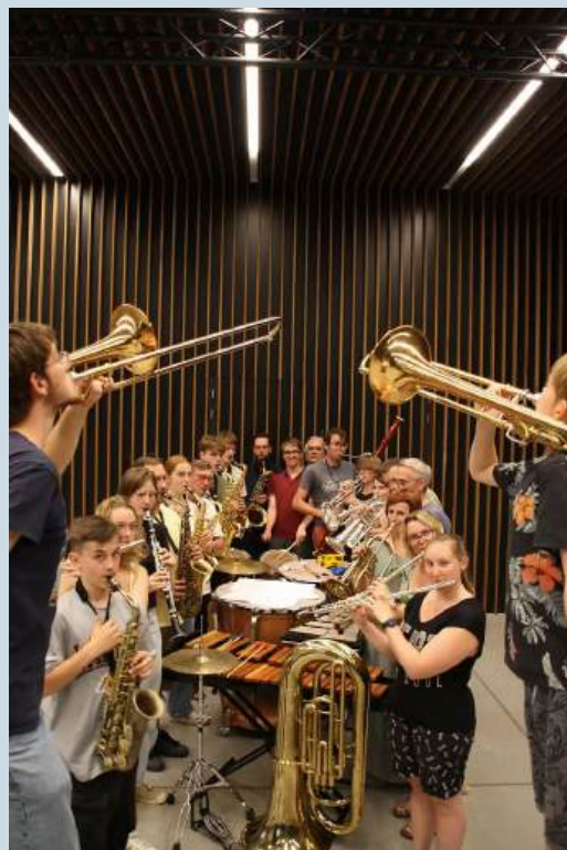
Onze Weergalm is niet de enige blaasmuziekvereniging in het Leuvense waar een gezonde, gezellige gekte heerst ...